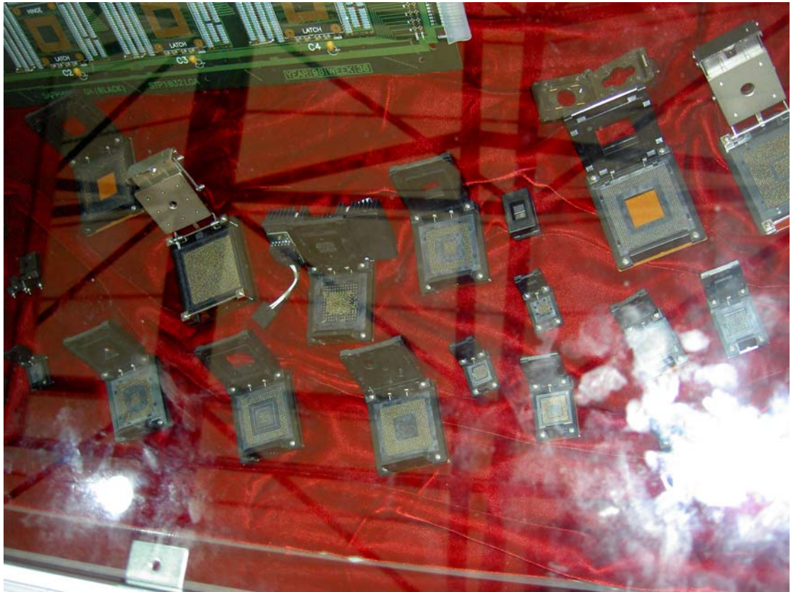
展台上展示的部分测试/老化插座