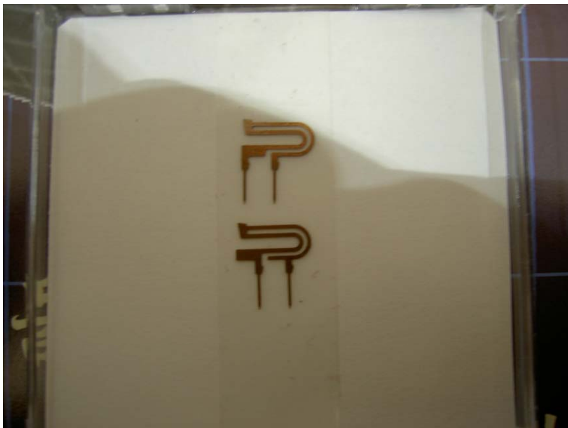
展台上展示的 Kelvin 连接件 (Contactor) 实例