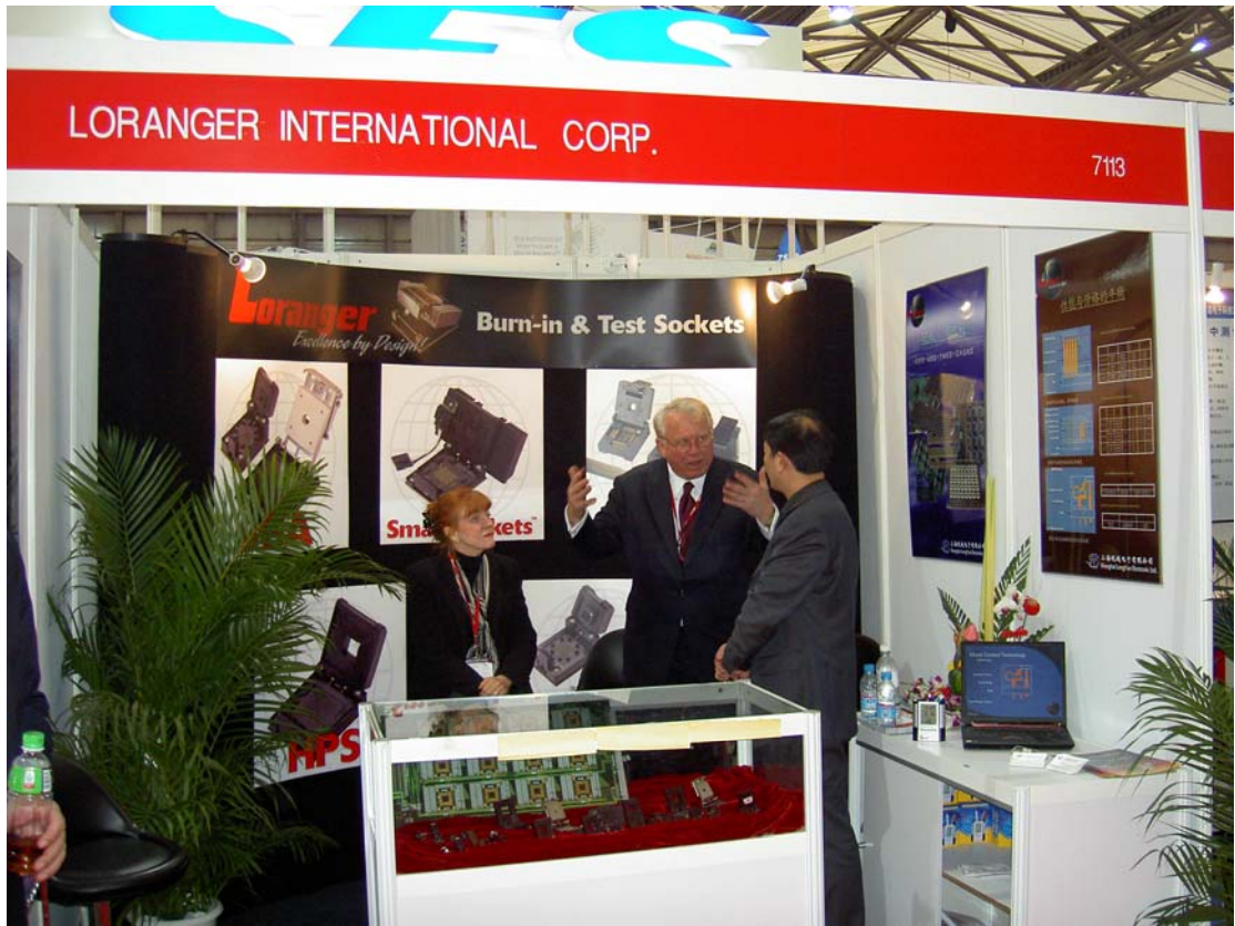
2004 年上海 Semicon 展台 7113。