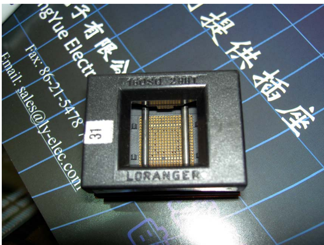
BGA 顶开式 Opentop 老化/测试插座实例