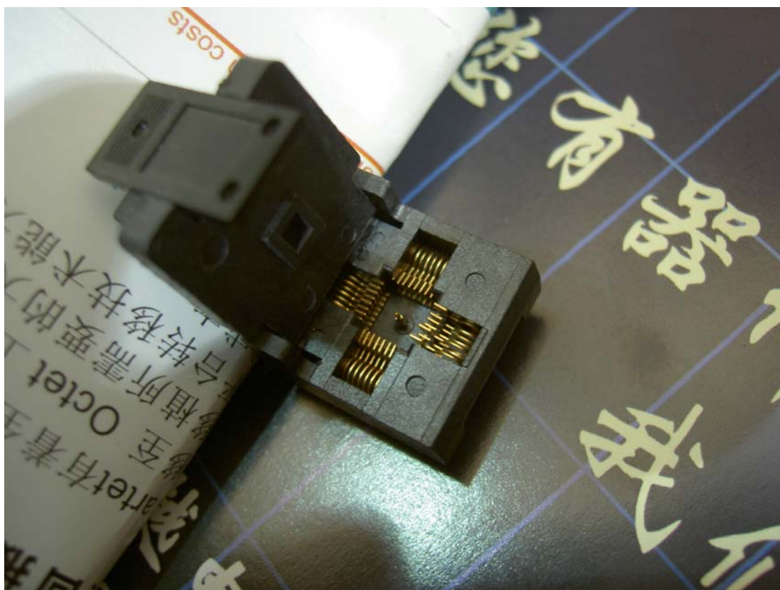
C型连接器 Kelvin 带中心点的 QFN 测试/老化插座实例